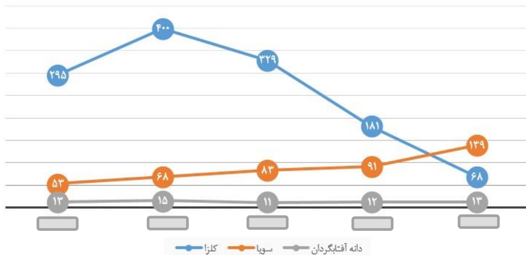
میزان تولید دانه های روغنی - 1399-1395 - هزار تن

بر پایه آمار منتشر شده توسط وزارت جهاد کشاورزی، در راستای اجرای طرح کشت دانه های روغنی، میزان تولید کلزا با افزایش 120 هزار تنی، به 295 هزار تن در سال 1399 رسید. نمودار زیر میزان تولید سه دانه پرمصرف کلزا، سویا و آفتابگردان در بازه 1395 تا 1399 را نشان می دهد.